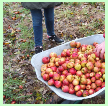
Ramassage des pommes, épuisant !