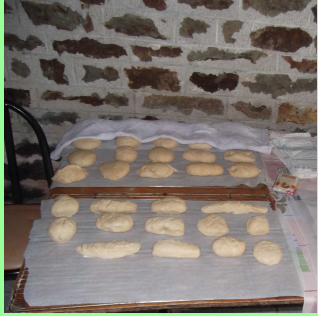
Pain qui se repose pendant plusieurs heures...

Puis, une moitié des élèves est partie faire du pain bio. La classe s'est mise autour d'une table. Les élèves ont parlé des ingrédients avant de se mettre au travail. Pour faire du pain, il faut quatre ingrédients (farine, sel, levure et de l'eau tiède). Après, ils ont pétri la pâte et ont attendu qu'elle lève avant de la cuire.